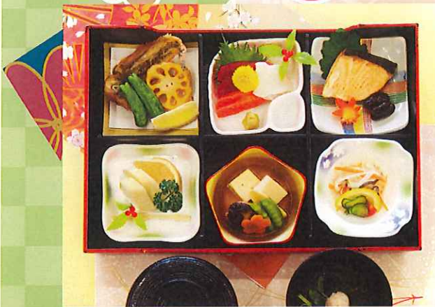
花葉館特製お弁当 ¥3,600