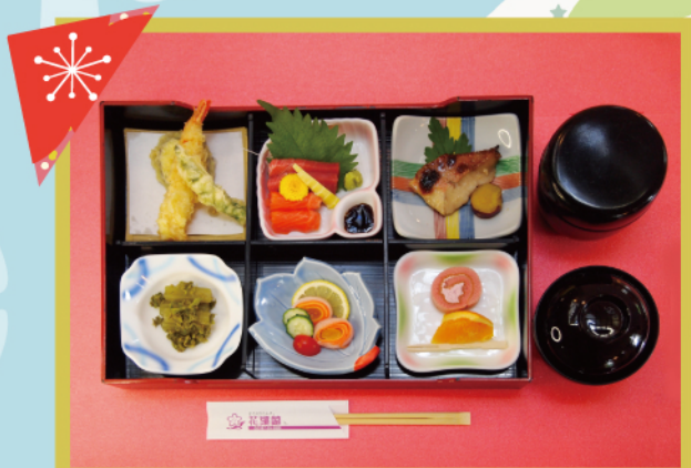
花葉館特製お弁当 ¥3,900